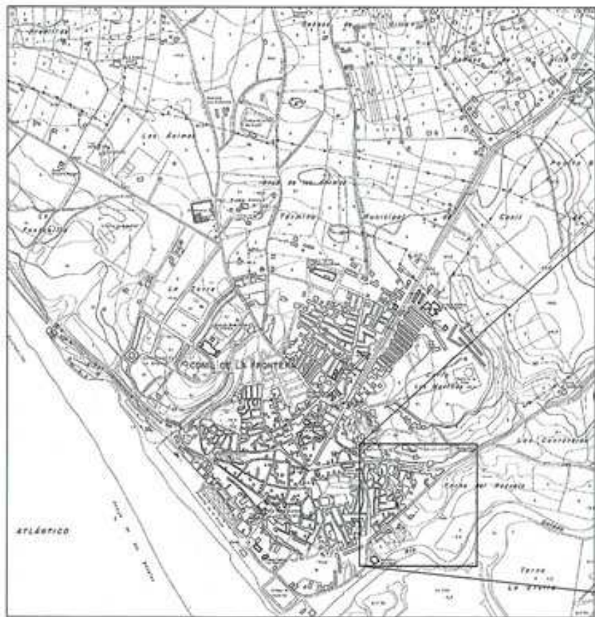
PLANO DE SITUACION, CONIL DE LA FRONTERA